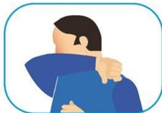
4 Protocolo de estornudo y tos