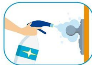
3 Limpiar las superficies de alto contacto