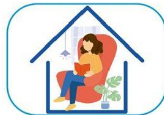
6 Quedate en casa