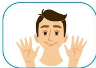
2 No se toque la cara si no se ha lavado las manos