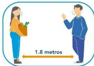
5 Distanciamiento social