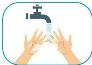
1 Lavado de manos