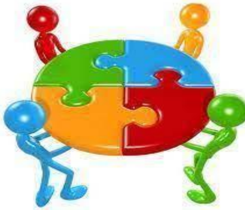
Imagen con fines educativos.