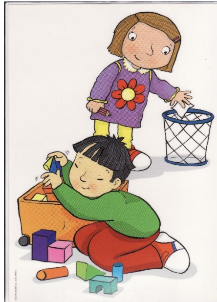
Imagen con fines educativos.