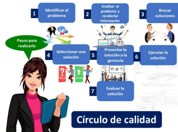
Imagen con fines educativos.