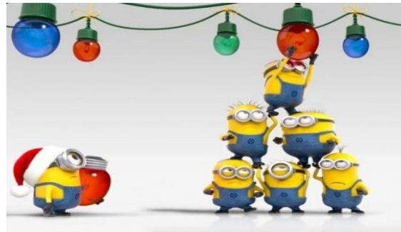
Imagen con fines educativos.