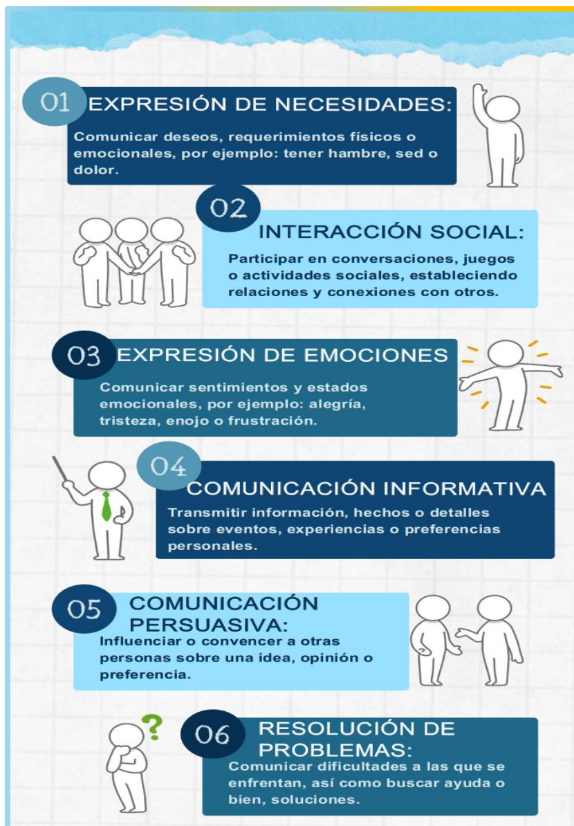
Figura 1: Funciones comunicativas

Nota: Elaboración propia con datos de AlfaSAAC (s.f.). Recurso en Canva [Aplicación móvil].