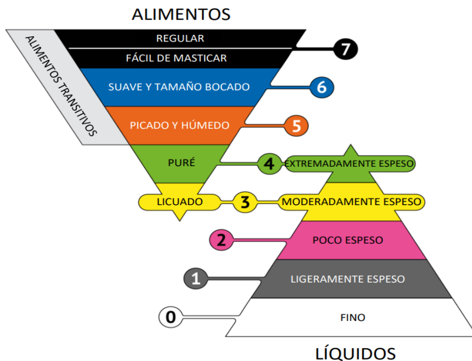
Figura 3: Clasificación IDDSI de alimentos y líquidos