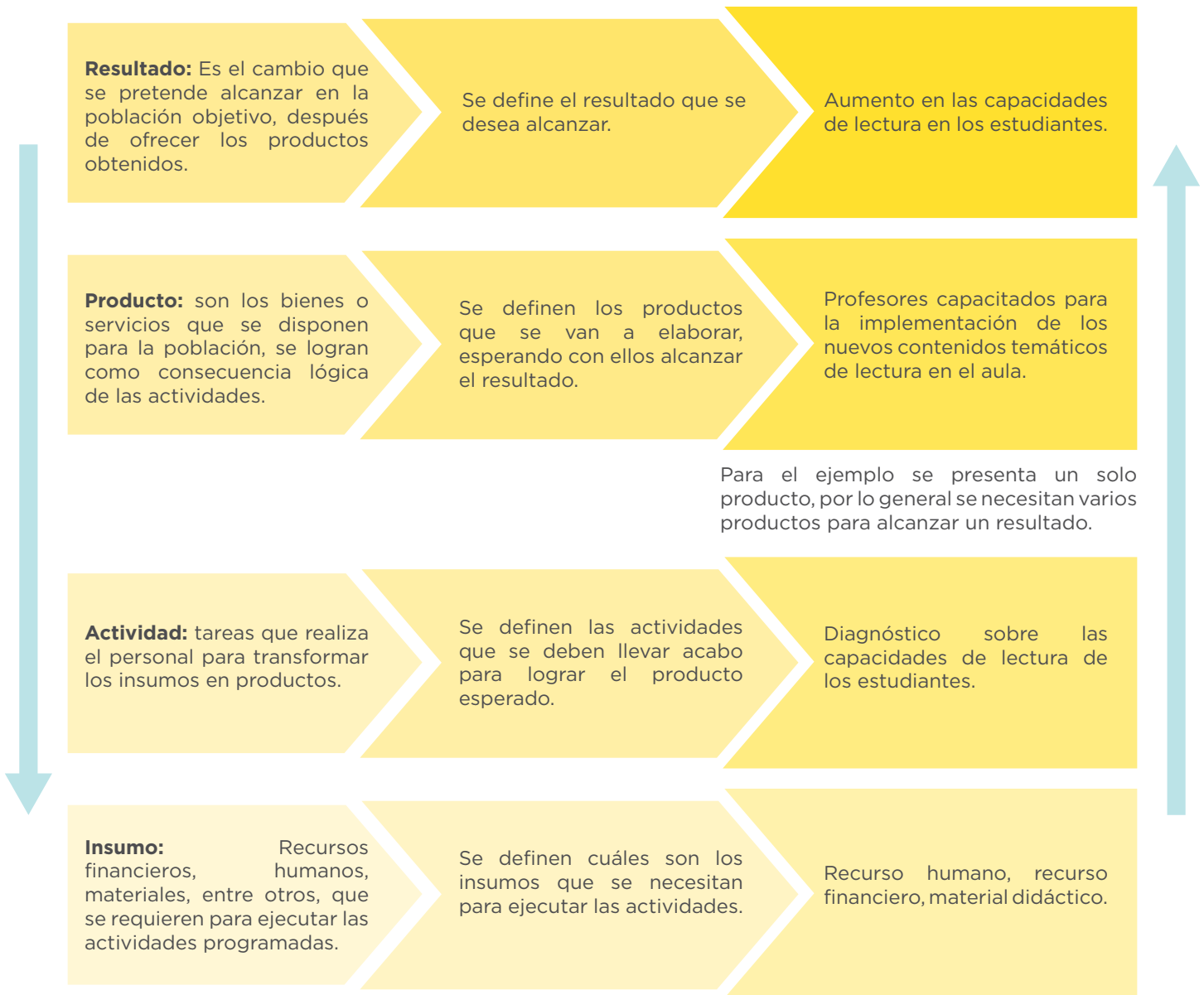
Figura 1. Cadena de resultados. Ejemplo de un centro educativo.